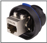
I4COUPL6AIP68 Coupleur RJ45 CAT6A blindé IP68