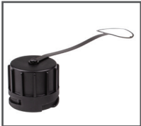
I4CAPPLUG Bouchon d'étanchéité pour PLUG RJ45