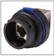
I46AFSIP68 Connecteur RJ45 CAT6A blindé IP68