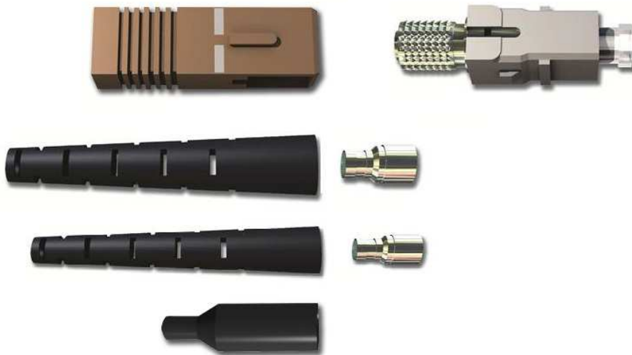
Réf: 48MMCSCS connecteur SC UPC simplex, prévu pour OM1, OM2, OM3, OM4

Connecteur optique SC UPC simplex multimode - câbles 2mm / 3mm