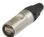
Neutrik Ethercon : NE8MX6